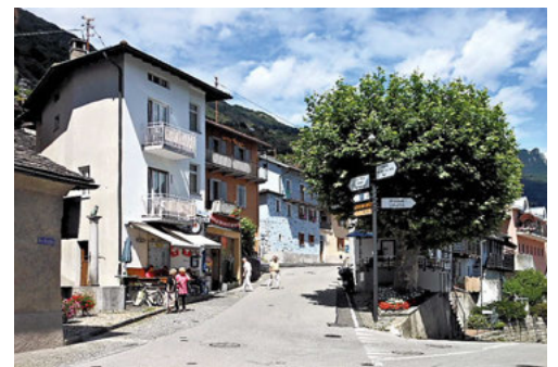
1892, la piazza del paese. Un'immagine importante dal punto di vista storico in quanto permette di notare come, in oltre 120 anni, la piazza abbia mantenuto la sua antica configurazione rimanendo, soprattutto, il cuore del villaggio.