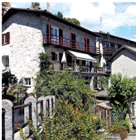
Anni '50. Lo stesso piccolo nucleo in Salita Sassello 60 anni dopo.