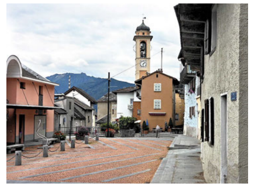
Via Contra, nello stesso periodo, a confronto con la piazzetta odierna.