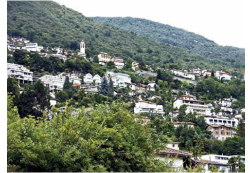
Panoramica: ieri (Anni Cinquanta del secolo scorso) e oggi. Ogni commento è superfluo.