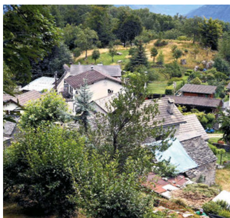
Anche i monti cambiano. Questa è Tendrasca negli anni '50 e oggi, ripresa dallo stesso punto di vista.